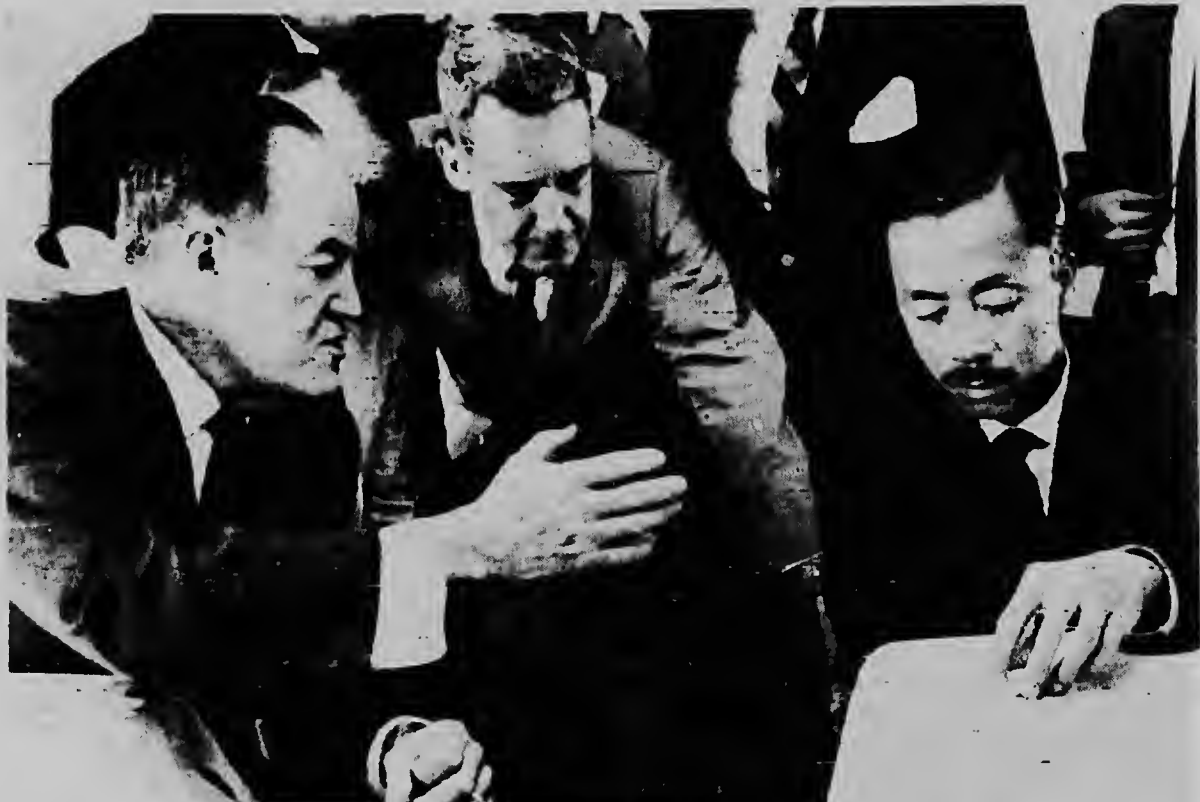
RIBA PACIFICO--Vice-presidente Hubert Humphrey (na man robes) ta conferenciando cu prome minister survietnames Nguyen Cao Ky, den cabina di un avion jet di Forsa Aerea, na caminda pa Saigon. Otro oficialnan norteamericano y vietnames ta mirando.

Den e zona caminda e cooperacion combina di aliadonan ta opera, miles Vietnamesnan desplaza di nan poblacionnan ta riba camindanan di comunicacion, estrobando den varios caso momentu dje trupanan.